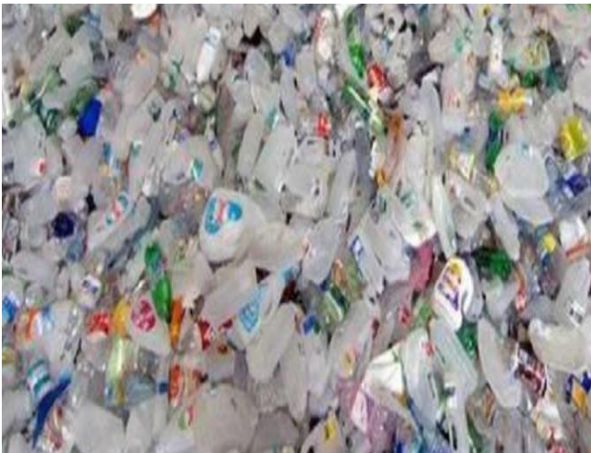
Слика 8.2.1 Амбалажни отпад

У складу са Директивом европског законодавства о амбалажи и амбалажном отпаду бр. 94/62/ЕЦ, регион би морао: