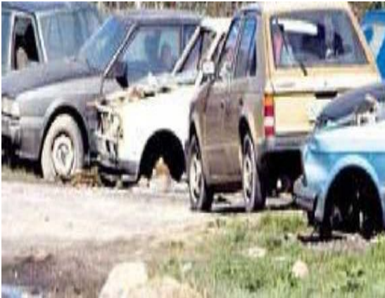
Слика 8.4.1 Ислужена возила

У складу са Директивом европског законодавства о ислуженим возилима бр. 2000/53/ЕЦ, дати су следећи предлози :