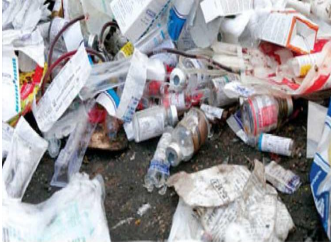
Слика 7.5.1 Неадекватно управљање медицинским отпадом

Као и за већину других врста отпада, у Србији постоји врло ограничен број поузданих података о настајању медицинског отпада, било да се ради о биохазардном медицинском отпаду или о укупном отпаду из здравствених установа. Треба истаћи да углавном нема раздвајања отпада на извору, као и да се медицински отпад депонује уз остали комунални отпад на депонији-сметлишту. Нема посебних мера предострожности или процедура за руковање, транспорт или одлагање отпада из медицинских или сличних објеката.