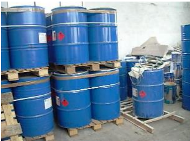
Слика 7.4.1. Опасан отпад

О количинама и врстама створених, прихваћених, обрађених и ускладиштених опасних отпадака извештава се министарство надлежно за послове заштите животне средине једанпут месечно, до десетог у месецу за претходни месец