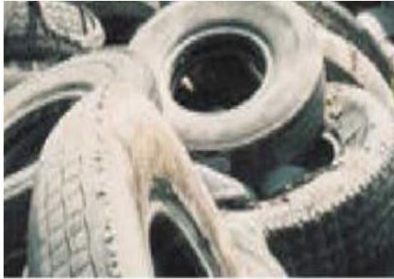
Слика 8.5.1 Отпадне гуме

.У вези са Директивом европског законодавства о депоновању отпада, бр. 1999/31/ЕЦ, општина би у складу са захтевима директиве морала да: