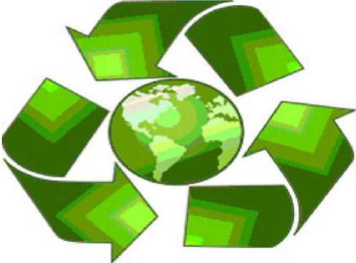
Слика 13.1. Међународни симбол за рециклажу