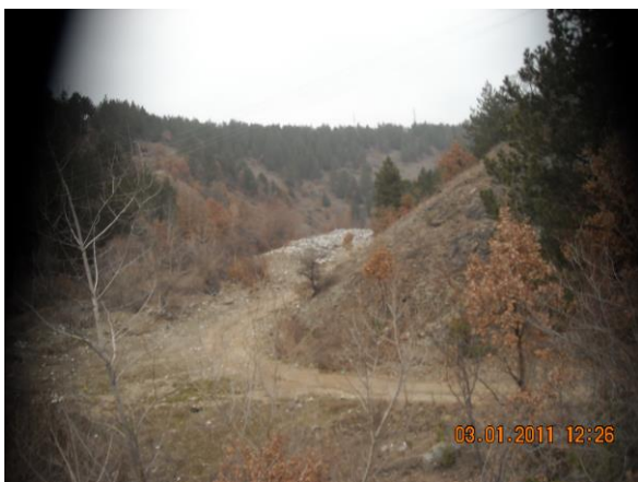
Слика тренутне локације депоније