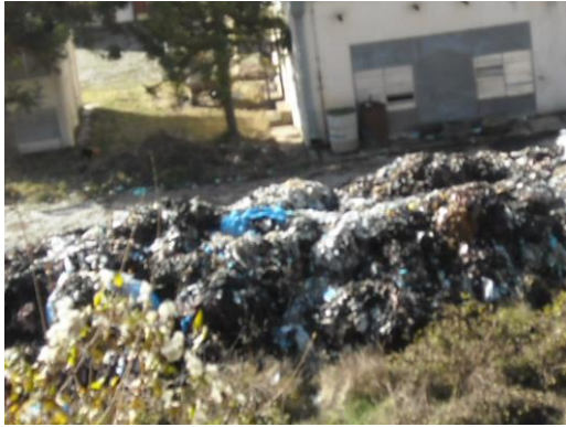
Слика индустријског отпада

Постоји врло мало података о индустријском отпаду. Евиденција индустријског отпада се не врши систематски и у складу са законском регулативом. Под индустријским отпадом се подразумевају све врсте отпадног материјала и нуспроизвода који настају током одређених технолошких процеса.