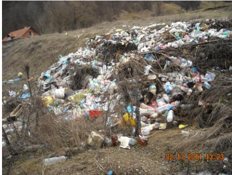
Слика 4.1.1. Непримерено одлагање отпада

Када се ради о комуналном отпаду, у ланцу његовог кретања сво касније поступање у много чему зависи од првог корака: НАЧИНА КАКО СЕ САКУПЉА СМЕЋЕ. Тренутно комунално предузеће није довољно опремљено да на овом првом кораку потпуно контролише стање, већ је приморано да решава проблеме тек када су ескалирали. Пуно времена и новца се губи на сакупљању смећа са " дивљих сметилишта, сакупљање отпада расутог поред препуњених судова за смеће,поправкама возила после њиховог преоптерећења и др.