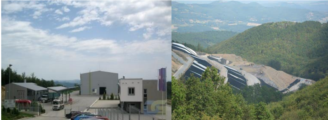
Slika H. Regionalna deponija “Duboko” (postrojenje za preradu otpada levo i telo deponije desno)

Pored navedenih objekata sanitarna deponija “Duboko” ima i prateće objekte, a to su transfer stanice koje će biti izgrađene u svim opštinama osim u opštini Užice.