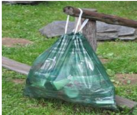
Slika 8. Simboličan prikaz kesa za suvo sakupljanje PET ambalaže i drugih vrsta materijala

Od ostale opreme, JKP „Komunalno“ poseduje mehanizaciju i vozila za sakupljanje otpada, shodno navedenom u poglavlju 4.3., kao i jednu presu za baliranje.