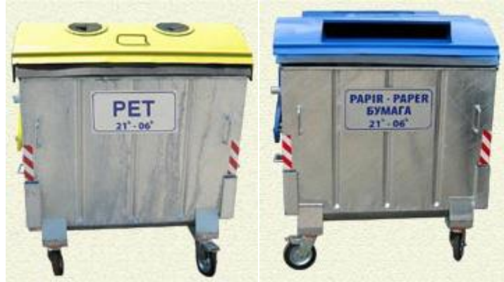
Slika7. Simboličan prikaz planiranih kontejnera za sakupljanje PET-a i papira